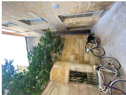
Après cour privative du T3 en rdc

Ici, 23 rue Bouviers. inCité a acquis, sécurisé puis revendu l'immeuble à Aquitanis avec un programme défini de réhabilitation complète pour produire 6 logements sociaux publics dont 1 T3 d'environ 90 m 2 avec une cour, 2 T2 d'environ 50 m 2 , 2 T3 de plus de 65 m 2 et 1 T4 d'environ 95 m 2 ainsi que des parties communes aménagées (locaux vélo et poubelle). Cet immeuble faisait l'objet de travaux obligatoires dans le cadre d'une opération de restauration immobilière avant qu'un incendie ne vienne le dégrader davantage. inCité a procédé à la réalisation de travaux de sécurisation avant de céder le bien au bailleur social afin que celui-ci réalise les travaux prescrits. Les équipes d'inCité ont également géré la première attribution de la moitié des logements à des ménages du quartier Saint-Michel en attente d'un relogement définitif.